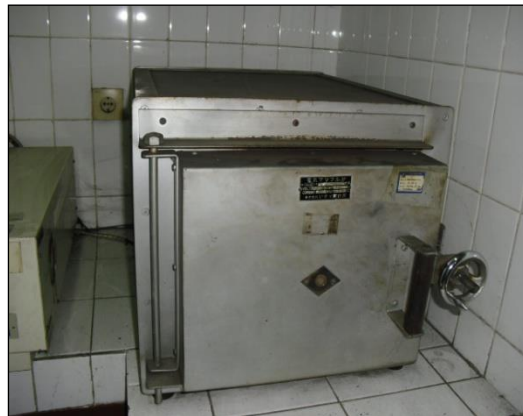
Gambar 3.3 Oven listrik